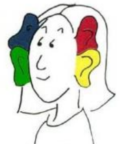
Empfänger mit vier Ohren